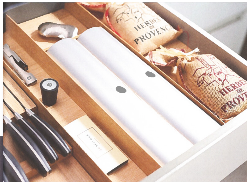
De foliehouder, een van de handige multifunctionele inserts.

De keukenlade kan wel eens een onoverzichtelijke warboel worden. Nochtans zijn de nodige opbergssystemen beschikbaar die orde in deze wanorde scheppen. De productontwikkelaars van Kesseböhmer rustten niet op hun lauweren en met een simpel zinnetje ('Doe meer met minder') in het achterhoofd gingen ze aan de slag om een nieuw systeem te ontwikkelen. Ultieme flexibiliteit met een minimum aan componenten. Het resultaat is Fineline LiniQ. "Inzetbaar in alle op de markt beschikbare keukenlades", benadrukken zowel fabrikant Kesseböhmer als verdeler Van Opstal.