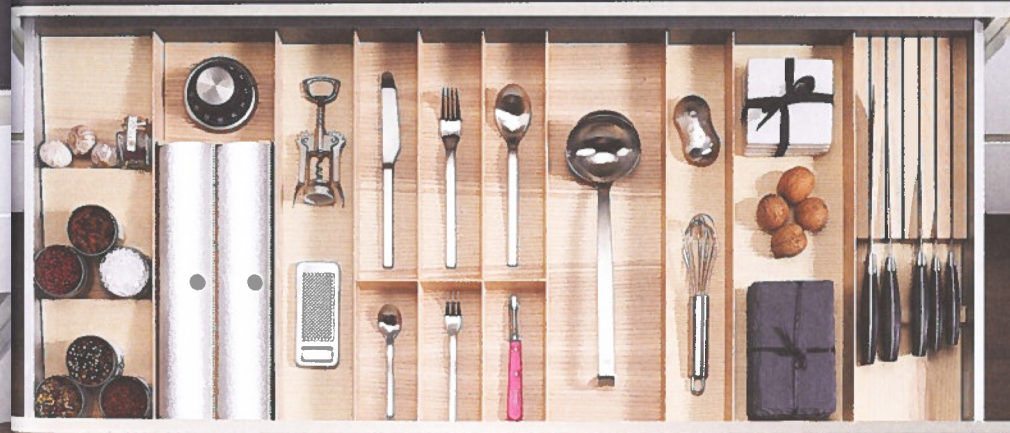
Een voorbeeld van Fineline LiniQ in Noorse es, compleet met alle beschikbare accessoires.

Ook voor de hogere lades, daar waar traditioneel de potten en pannen opgeborgen worden, creëerden de productontwikkelaars van Kesseböhmer nieuwe elementen. "Een vierkant en een rechthoekig bakje met greepgaten, eveneens beschikbaar in de hierboven genoemde drie houten afwerkingen, scheppen meteen orde in deze hogere laden", aldus Van Opstal. "Twee vierkante bakjes naast elkaar zijn trouwens even lang als één rechthoekige. Zo kan de gebruiker van de lades naar eigen wens en inschatting de juiste keuze maken. Een metalen verdeelstuk met greepgaten kan, indien gewenst, ingezet worden in deze bakjes. Ook handig in deze hogere laden is een aanpasbaar houten borderek zodat grote of kleine borden hier veilig gestapeld kunnen worden." •