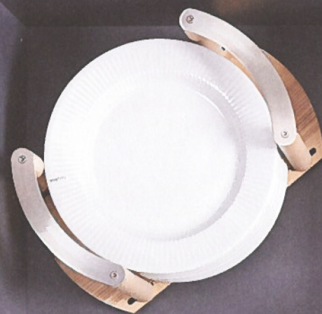
Ook nieuwe oplossingen voor de hogere lades waar potten en pannen in terechtkunnen.